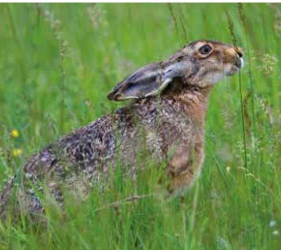
Feldhase auf Wiese

Jägerinnen und Jäger zählen Feldhasen nachts auf genau festgelegten Strecken mit genormten Scheinwerfern. Die Augen der Hasen reflektieren das Licht arttypisch, eine Unterscheidung von anderen nachtaktiven Tieren wie dem Fuchs ist leicht möglich. Wissenschaftler werten die Daten anschließend aus. Gezählt wird nach Möglichkeit mindestens zweimal im Frühjahr und im Herbst. Die rund 400 Referenzgebiete sind nach Großlandschaften unterteilt, die sich jeweils in Faktoren wie Geologie, Boden, Klima und Vegetation unterscheiden.