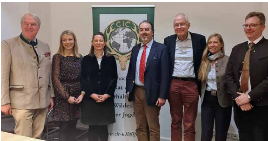
Der CIC Vorstand